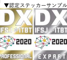
▼認定ステッカーサンプル